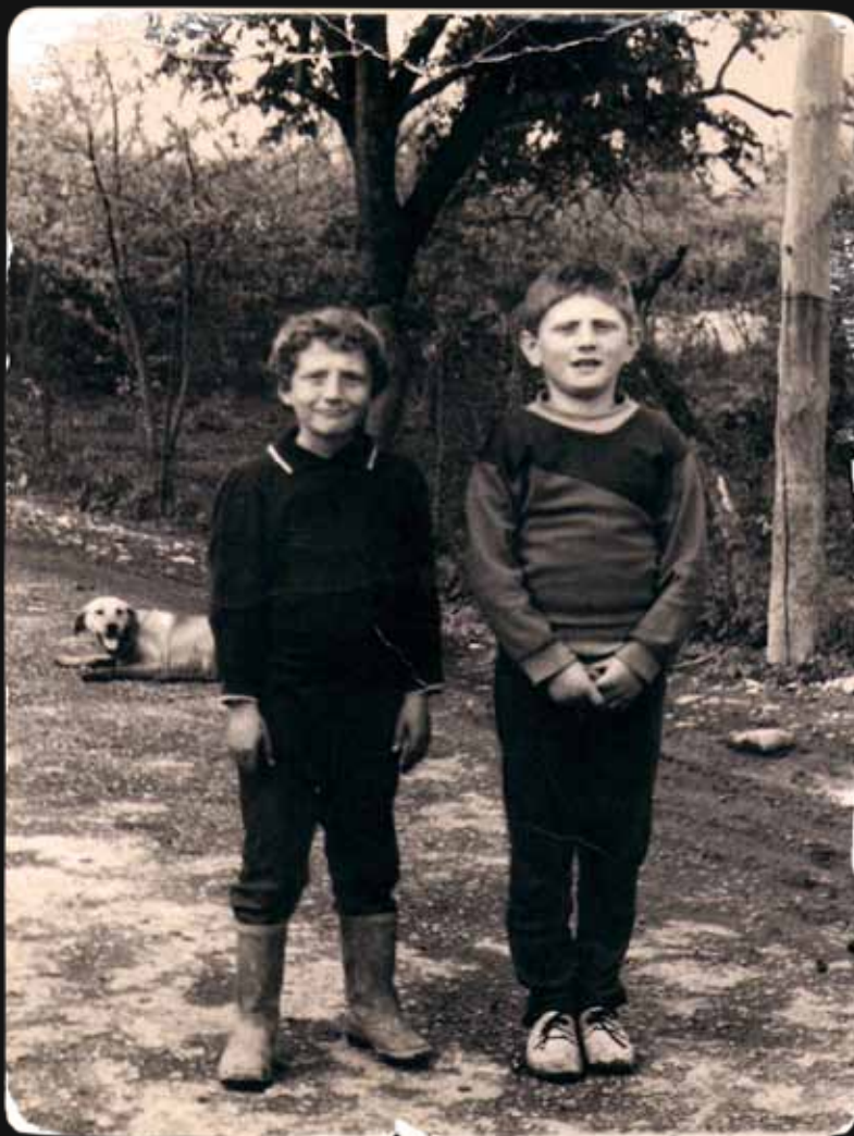
19 июня 1989 года. Грузия, Сванетия

за которыми выстраивались очереди, младший — помогал возводить крепкие, надежные дома. А ещё их связывала идея — открыть свой собственный семейный ресторан. Три года ушло на возведение «Усадьбы» с нуля — и мы счастливы видеть вас в её стенах!