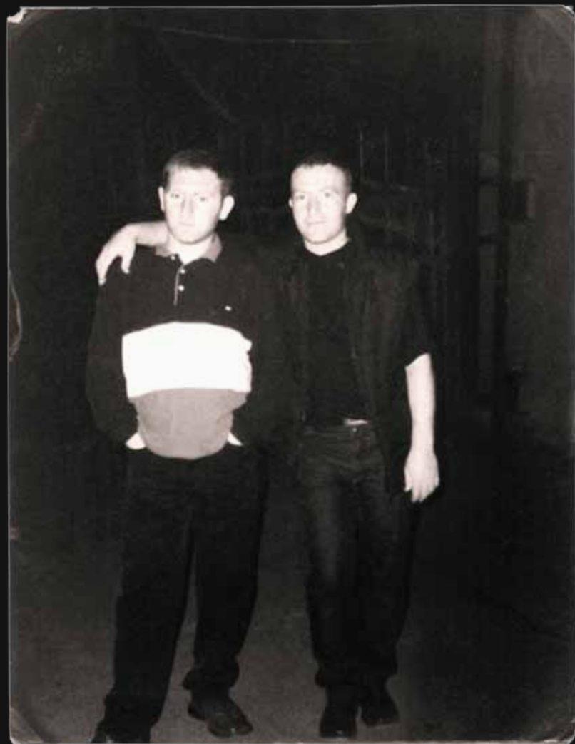
25 августа 2000 года. Санкт-Петербург

Здесь в каждом уголке — наше трудолюбие, тепло и внимание. Здесь всё создано для семейных встреч, долгих бесед и неспешных ужинов, ведь мы понимаем ценность семьи. Наши супруги помогали нам на пути к мечте с самого начала. Наши близкие, оставшиеся